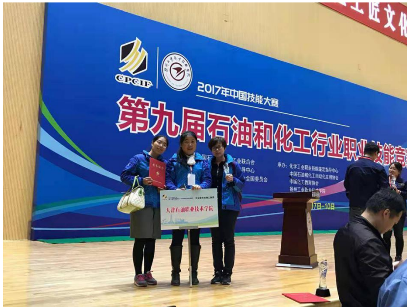
图 2：教师参加技能大赛获奖

人次，指导学生参加技能大赛获得国赛二等奖 1 人次、三等奖 2 人次、省部级一等奖 1 人次、二等奖 7 人次，教学能力明显提升。